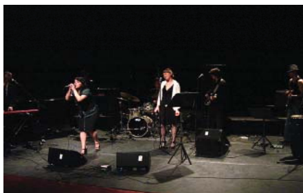
Lisää Close Encounters kuvia...