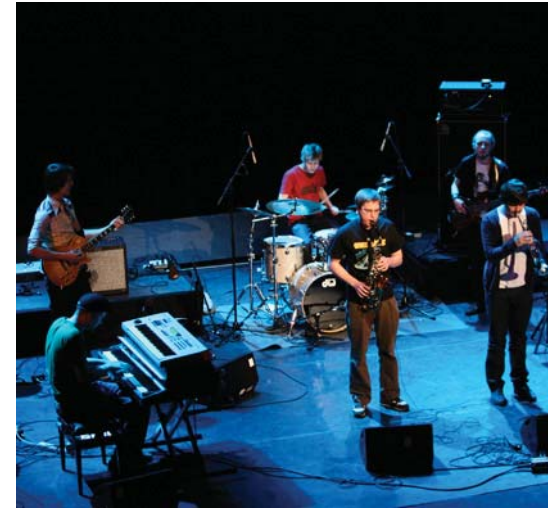
Nuts & Bolts