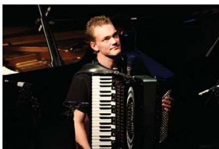
Raise Your Voices!