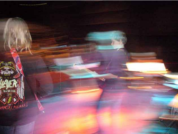
Classic Rock -yhtye Arabia-salissa 5.12.06

Pop & Jazz Konservatorion varhaiskasvatus on nopeassa kasvussa - nyt jo yli 250 musiikkileikkikoululaista. Toisaalta yli 10-vuotiaiden määrä junnaa paikoillaan ja paineet sisäänpääsyn osalta kasvavat vuosi vuodelta. Purkuventtiilinä alle 10-vuotiaiden osalta toimii Kiihdytyskaista, mutta yli 10-vuotiaat uhkaavat jäädä jonotuslistalle mikäli Helsingin kaupunki ja Suomen valtio eivät ota vastuutaan rahoitusvääristymän korjaamisesta!