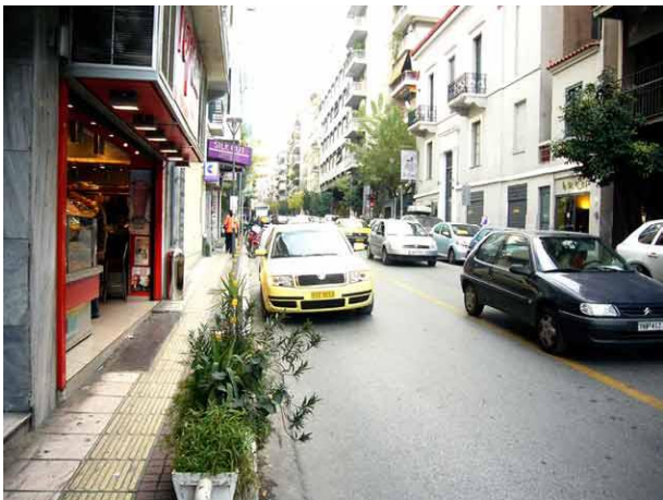
Katunäkymä koulun edestä

Philippos Nakas sijaitsee aivan Ateenan sykkeessä. Suomi-Saksa seura selvitti tiensä pakokaasun ja melun läpi aamuisin (siis aikaisintaan puolen päivän aikaan) urheasti kokoukseen. Kreikkalaiset olivat parikymmentä minuuttia myöhässä arjalaisten jo taputtaessa jalkaa lattiaan, mutta Iran Kreikka-taskuoppaan mukkaan tapoihin kuuluu että isäntä saakin myöhästyä.