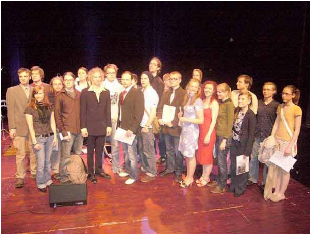
Kuvassa keväällä 2007 valmistuneet muusikot ja musiikkiteknologit

Musiikkialan ammatilliseen perustutkintoon johtavat opinnot on tarkoitettu opiskelijoille, jotka peruskoulun suorittuaan haluavat valmistua musiikkialan ammattiin rytmimusiikin alueella. Ammatillisesta koulutuksesta valmistuu rytmimusiikin alan perustehtävät monipuolisesti hallitsevia muusikoita ja musiikkiteknologeja yhtye- ja orkesterimuusikon tai musiikkiteknologin tutkintonimikkeillä.