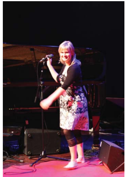
Allt Ijus på oss!