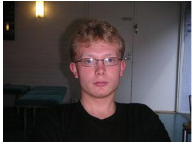
TYÖ HALLITUKSESSA: Yleinen härvääjä TUNNUSTA NOLOIN PITÄMÄSI ARTISTI/BÄNDI: Madonnan uusien abba kopio