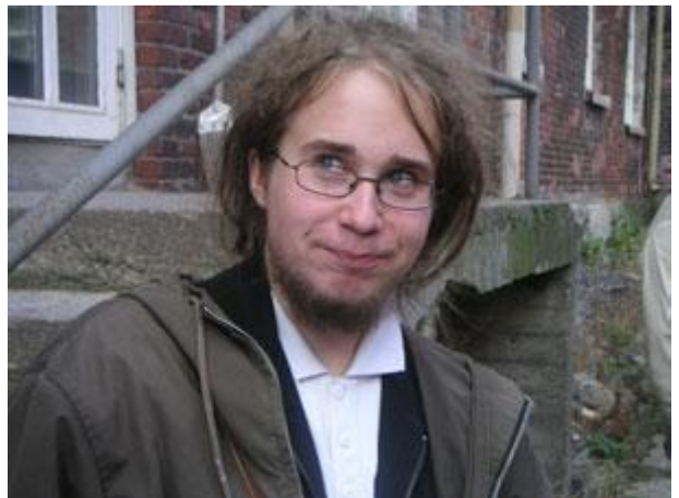
TYÖ HALLITUKSESSA: Rahastonhoitaja TUNNUSTA NOLOIN PITÄMÄSI ARTISTI/BÄNDI: David Sanborn, vaikka ei se edes ole nolo.