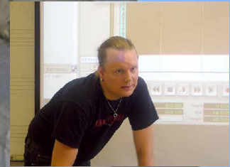
Henkilöstön koulutusviikko 13.-17.8.07